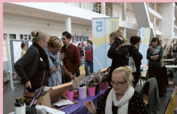
◀ Stand des Jugendtreffs Drehscheibe - Comicbuchprojekt

Alle Produkte der zusatzgeförderten AddOn-Projekte wie Fachbücher, Methodensammlungen, Planspiele und Handreichungen sind kostenfrei bei der AGOT-NRW auf Anfrage erhältlich. Kontakt: info@agot-nrw.de